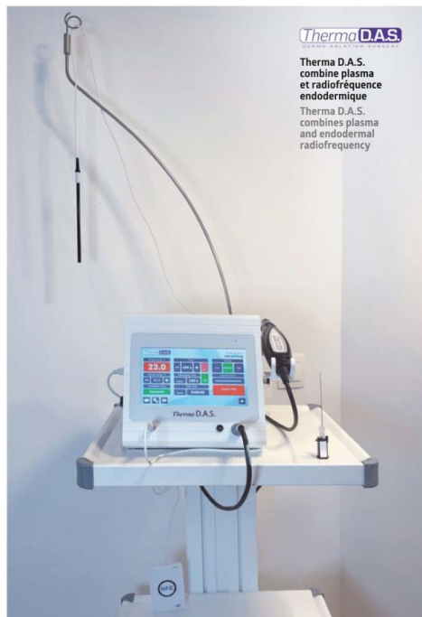
Thermo D.A.S. is a medical device made up of two main components (a third will be added in autumn 2021):