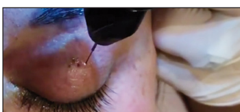
Ionisation d'air avec décharges Aiguille à proximité de la peau pour un effet plasma dermo-ablatif.