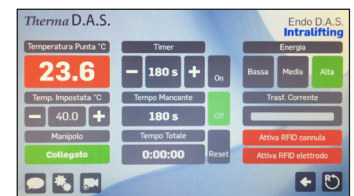
Interface Endo D.A.S.