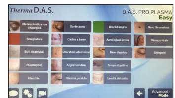
Interface D.A.S. Pro Plasma

D.A.S. Pro Plasma. La fonction dermo-ablative du Therma D.A.S. est basée sur l'amplification d'énergie qui permet de couper et coaguler la peau. Le principe d'induction utilisé lors du traitement est obtenu par une succession de décharges électriques générées par un courant à tension élevée. Avec une distance de 0,5mm entre la pointe du dispositif et la peau, l'air chargé d'électrons libres absorbe une grande quantité d'énergie, cesse d'être un isolant et commence à conduire le courant électrique, générant les décharges. L'air est ionisé et il devient Plasma. Les décharges fournissent une chaleur qui augmente la température de la peau et permettent de traiter de nombreuses indications sans risques de blesser le patient. Un appareil qui module la fréquence et puissance en mode fractionnel pour : Effectuer un resurfaçage de peau, Traiter les lésions cutanées bénignes du derme et épiderme, Réduire la laxité cutanée localisée, Améliorer la texture cutanée. Endo D.A.S. Innovante, la fonction radiofréquence endo-régulée du Therma D.A.S. est basée sur le chauffage progressif et contrôlé des tissus sous-cutanés avec une canule exclusive afin d'obtenir un lifting intra-dermique. Les séances durent 20 min et sont indolores. Le patient ressent un léger réchauffement de la zone traitée. Effets incroyables et positifs sur la peau : Amélioration de texture cutanée, Stimulation du collagène, Effets liftants, Rajeunissement cutané.